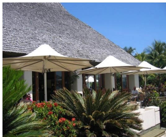
<リゾート地のホテル>