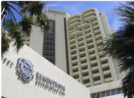
<有名ホテルの外観>