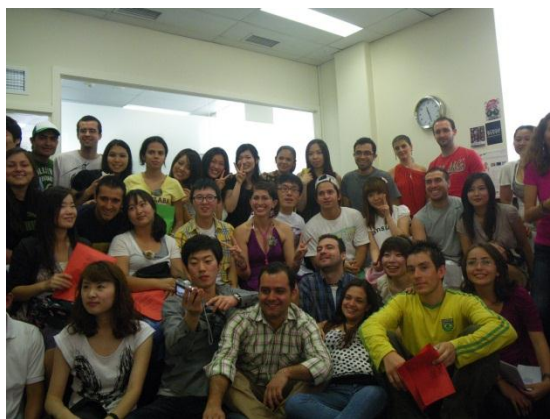
<ICQA クリスマスパーティー>

ICQAのキャンパス内ではワイヤレスのインターネットが完備されていますので、学校にいる間は生徒さんは自分のPCを自由に使うことができます。また、視聴覚機器や図書館もありますので、授業の終わった後で各自リスニングの練習をしたり、本を借りてリーディングスキルを向上させたりと、授業以外でも各生徒さんが自習できるよう充実した環境を整えています。