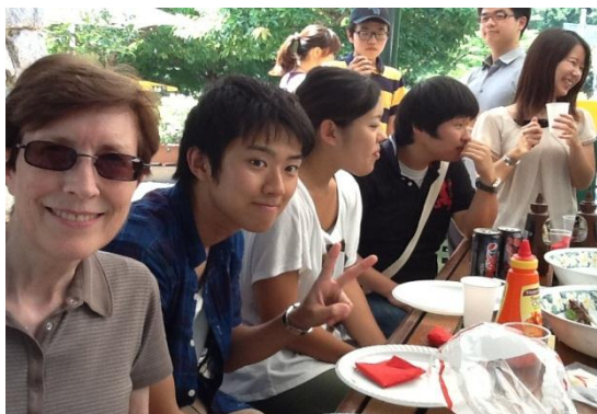
<ICQA バーベキューパーティー>

ICQAのキャンパス内ではワイヤレスのインターネットが完備されていますので、学校にいる間は生徒さんは自分のPCを自由に使うことができます。また、視聴覚機器や図書館もありますので、授業の終わった後で各自リスニングの練習をしたり、本を借りてリーディングスキルを向上させたりと、授業以外でも各生徒さんが自習できるよう充実した環境を整えています。