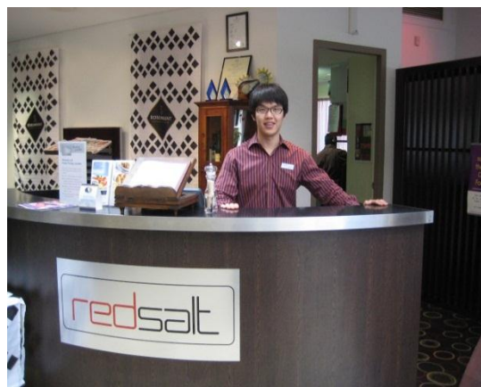
<ホテルのフロントデスク>