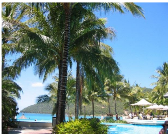
<リゾート地のホテルの周辺外観>

もし遠方からのテスト受験でリスニングテストが受けられない場合は、ICQA のディレクターと予め時間を決めておいて、電話による面接を行います。