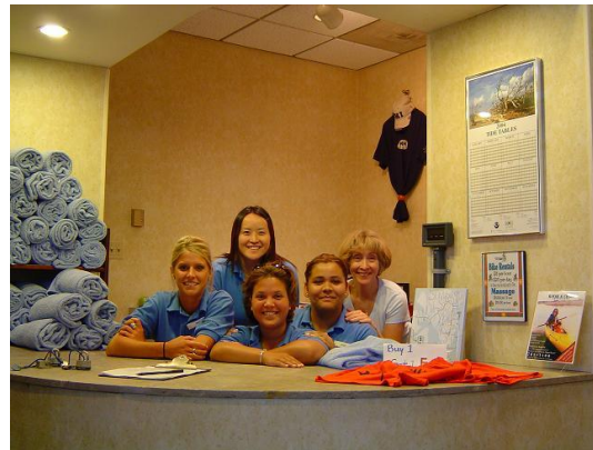
<研修先のホテルのスタッフと>